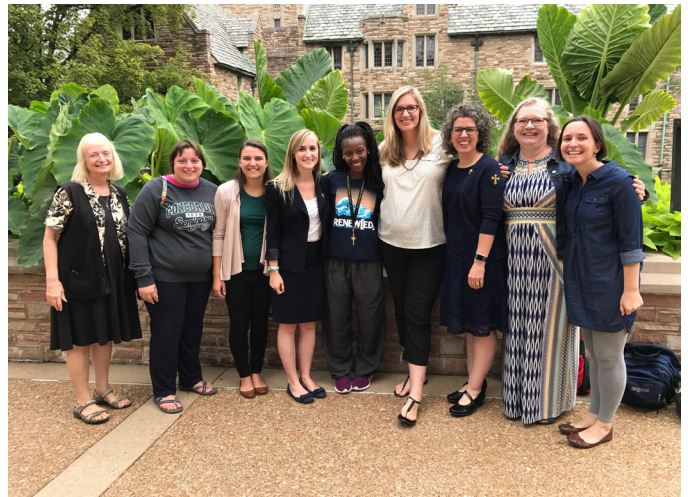
St. Louis area deaconesses featured outside chapel with Deaconess students from Concordia Seminary St. Louis at their monthly gathering.

Unless otherwise indicated, Scripture quotations from the ESV® Bible (The Holy Bible, English Standard Version®), copyright © 2001 by Crossway, a publishing ministry of Good News Publishers. Used by permission. All rights reserved.